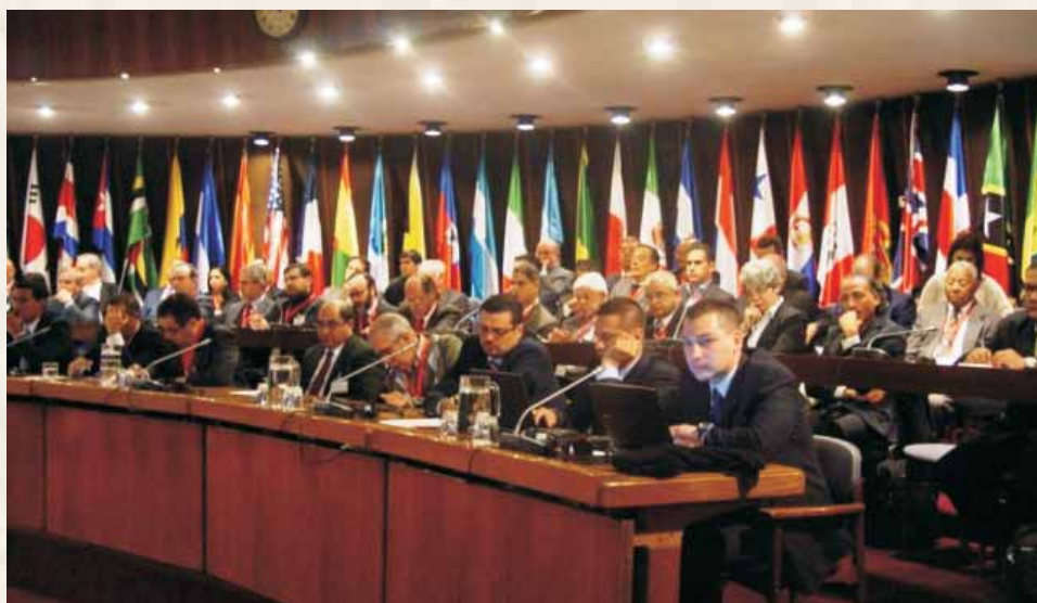
Participantes del XLVIII Conferencia Interamericana y El Caribe para la Vivienda CEPAL - Santiago de Chile

La XLVIII Conferencia Interamericana y El Caribe para la Vivienda se realizó del 18 al 20 de agosto de 2013, en la Sede de CEPAL, en Santiago, Chile y tuvo por finalidad analizar instrumentos, políticas, experiencias e iniciativas públicas y privadas para la promoción del ahorro, el financiamiento habitacional, la infraestructura urbana y el suelo para ciudades acogedoras y sostenibles, con la participación de expertos de América Latina y el Caribe, Estados Unidos y Europa.