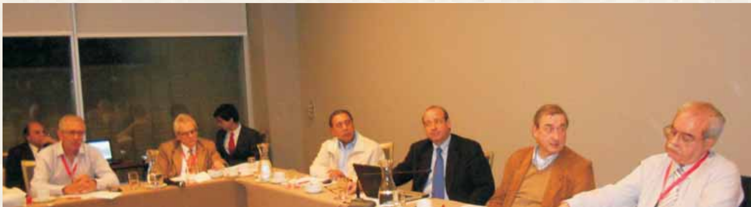
Reunión del Comité Ejecutivo 2013 / 2014: